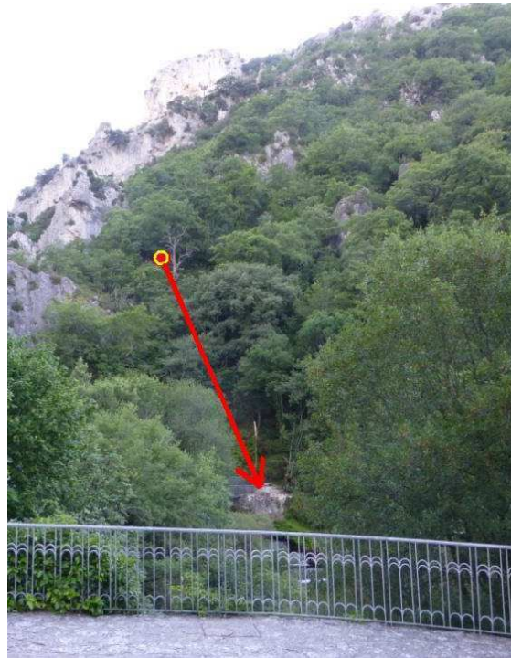
Fotografías 3 y 4: Bloque rocoso desprendido y trayectoria del desprendimiento en la ladera.