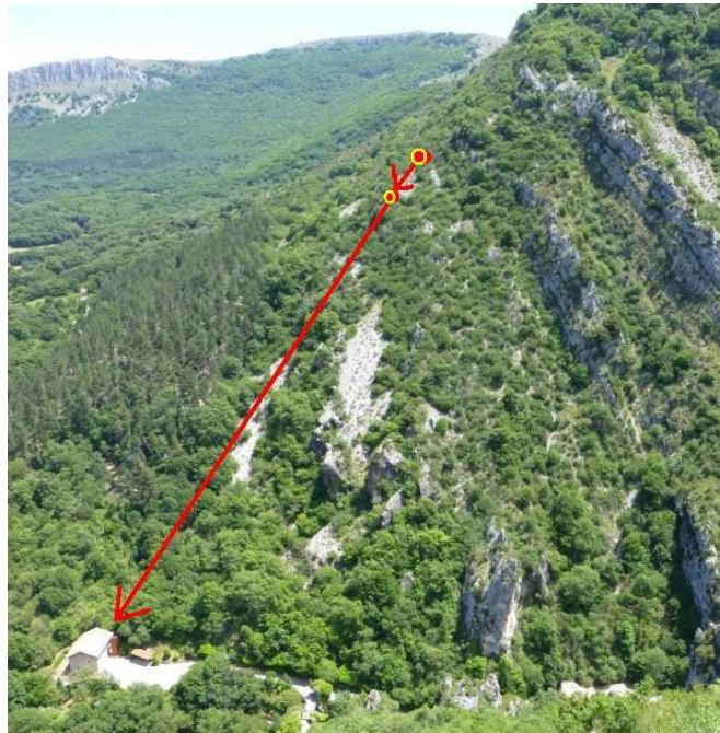
Fotografías 1 y 2: Bloque rocoso que impactó en el edificio y trayectoria del desprendimiento en la ladera.